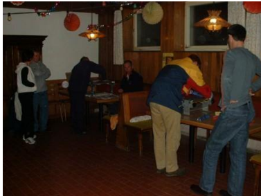
De avond ervoor.....spanning eruit

Toch nog even wandelen, kop koffie, terug naar onze gastheer, wel een biertje en vroeg naar bed.