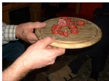
De bekende worst.....